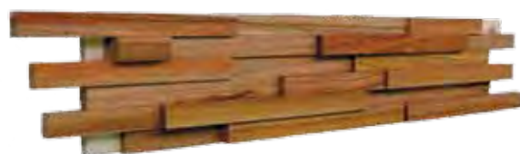
Tarara Amarilla 150 x 600 mm

Afmetingen paneeltjes: 150 x 600 mm Men heeft 11 paneeltjes per m 2 nodig 100% Handgemaakt Brandreactieklasse: D-s2,d0 Biologische duurzaamheid: Class 1 3D latjes van 100% FSC gecertificeerd hout Interlock systeem