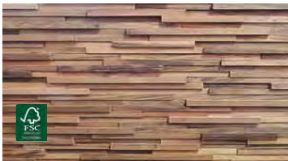
Curupau 25 mm

Op deze pagina ziet u verschillende houtsoorten waarin 3D panelen verkrijgbaar zijn.