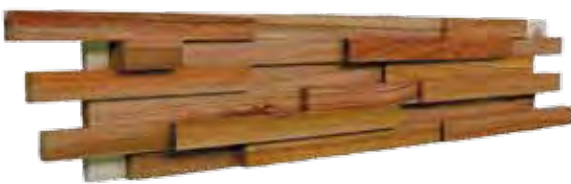
Tarara Amarilla paneel 150 x 600 mm