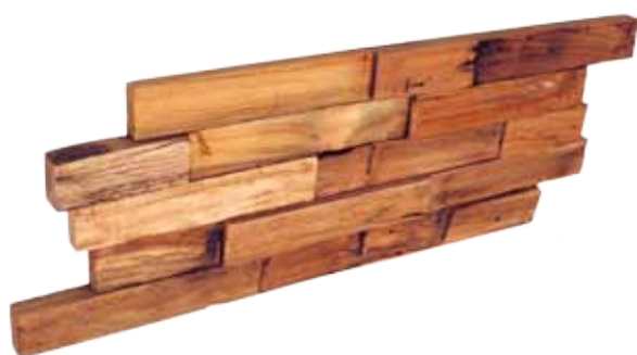
Teak Naturel 200 x 500 mm

Afmetingen paneeltjes: 150 x 600 mm Men heeft 11 paneeltjes per m 2 nodig 100% Handgemaakt Brandreactieklasse: D-s2,d0 Biologische duurzaamheid: Class 1 3D latjes van 100% FSC gecertificeerd hout Interlock systeem