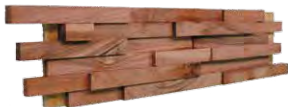
Curupau 150 x 600 mm

Deze pagina toont u de verschillende houtsoorten in 3D panelen.