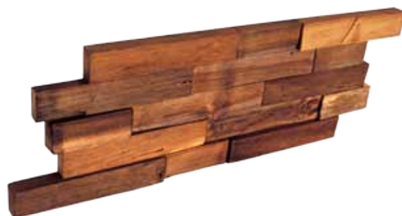
Teak Charred 200 x 500 mm

Afmetingen paneeltjes: 200 x 500 mm Men heeft 10 paneeltjes per m 2 nodig 100% Handgemaakt Brandreactieklasse: D-s2,d0 Biologische duurzaamheid: Class 1 100% FSC recycled teakhout Interlock systeem