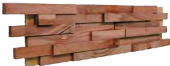
Curupau paneel 150 x 600 mm