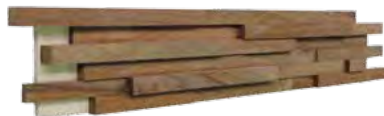
Tajibo 150 x 600 mm