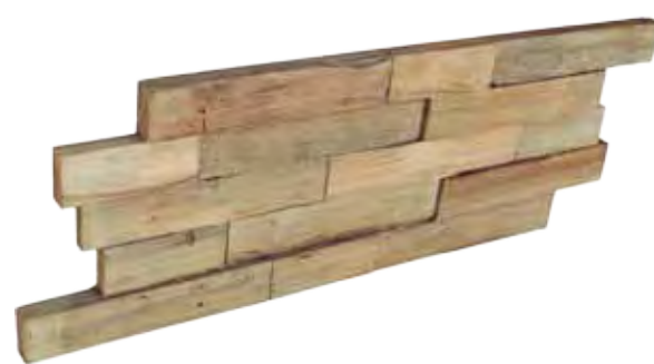
Teak Gunsmoked 200 x 500 mm