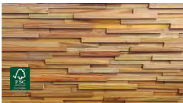
Tarara Amarilla 25 mm