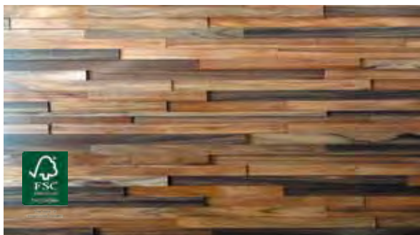
Tajibo 25 mm