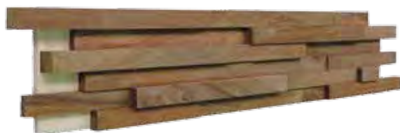
Tajibo paneel 150 x 600 mm